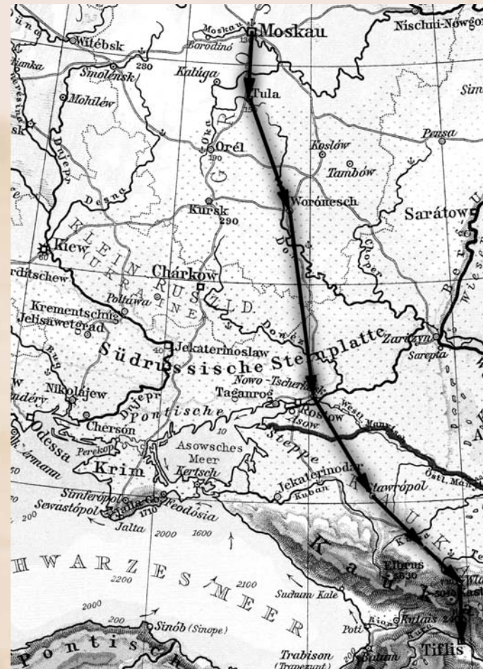
Bodenstedts Reiseroute 1843: Mit dem Pferdewagen über 1500 km von Moskau nach Tiflis

In der Tat muten heutzutage allein die damaligen Reisebedingungen mehr als abenteuerlich an: In Moskau hatte Bodenstedt einen „Tarantaß“ gekauft, „d.h. einen Wagen ohne Federn, aber etwas länger als die gewöhnlichen Telega's, dazu oben verdeckt und auch nach vorn mit einer ledernen Vorrichtung versehen, um Schutz wider den Regen zu bieten, der um diese Jahreszeit in der Steppe oft wochenlang anhält.“ Das neuerworbene Gefährt war gerade lang genug um darin ausgestreckt schlafen zu können, „wenn sich kein anderes Nachtquartier fand, was häufig genug vorkam, oder wenn ich es auf den Stationen vor Schmutz und Ungeziefer nicht aushalten konnte, was noch häufiger vorkam.“