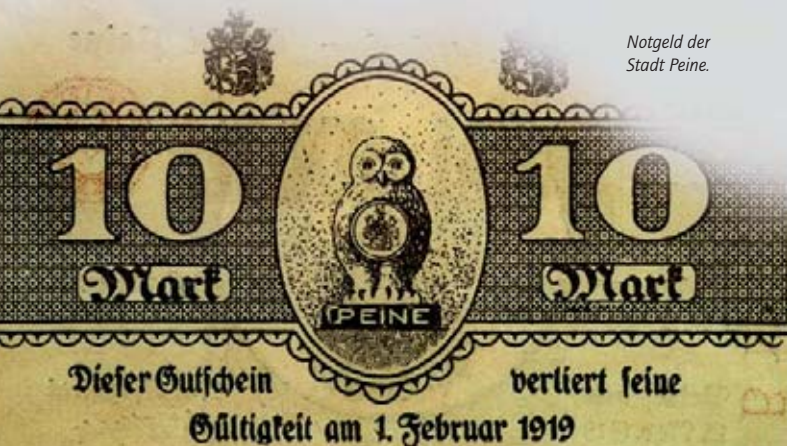
Notgeld der Stadt Peine.

Im Ersten Weltkrieg dagegen diente die Eule als „Kriegswahrzeichen“. Auf dem Marktplatz wurde im Mai 1916 die „Eiserne Eule“ aufgestellt, eine auf einem steinernen Sockel ruhende hölzerne Rundsäule, auf der die Peiner Eule thronte. Die Säule war zu einer sogenannten „Nagelung“ vorgesehen, eine besonder Spendenaktion für die Kriegshinterbliebenen und Verehrten, wie sie damals in ähnlicher Form in allen deutschen Städten durchgeführt wurde: Die Bevölkerung wurde aufgerufen, Nägel käuflich zu erwerben und einzuschlagen.