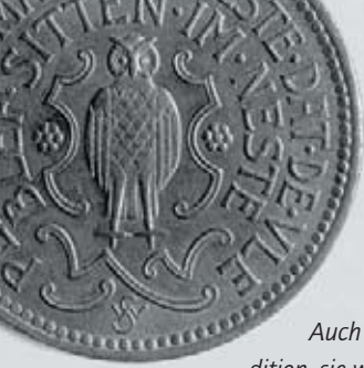
Gedenkmünze – 1923 herausgegeben von der Stadt Peine anlässlich der 700-Jahr-Feier.

Auch die Eulenpokale stehen in dieser Tradition, sie wurden – insbesondere im 17. Jahrhundert – vom Rat der Stadt an einflussreiche Personen verschenkt, um diese zu ehren bzw. für die Interessen der Stadt günstig zu stimmen. Der älteste erhaltene Pokal wurde 1661 gefertigt und befindet sich im Kestnermuseum Hannover; eine Nachbildung aus dem Jahr 1928 – von der Stadt Peine als Wanderpokal für das Rennen um die „Silberne Eule“ gestiftet – ist im Foyer des Forums ausgestellt. Preise in Eulenform wurden häufig vergeben; schon 1907 erhielt bei einem hier ausgetragenen „Gesangswettstreit“ der siegreiche Gesangsverein einen silbernen Eulenpokal.