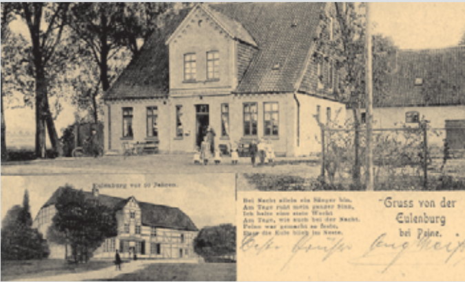
Die „Eulenburg“ Telgte um 1905

Zwei Jahre später kam die Eule erneut zum amtlichen Einsatz. Es herrschte ein allgemeiner Mangel an Zahlungsmitteln, und die Stadt Peine gab im November 1918 ersatzweise Notgeldscheine heraus, deren Rückseite als zentrales Motiv jeweils die Eule zierte.