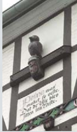
Hausfassade am Marktplatz Peine.

fliegt zur Stadt hinüber. Die Peiner aber fürchten sich nicht, nehmen den Fremdling wohlgenut auf und verehren die Eule als einen Schutzgeist. (Kluge Leute behaupten freilich, auch die Peiner Bürger hätten den sonderbaren Ankömmling durch Feuer vertreiben wollen und dabei die ganze Stadt eingeäschert.)"