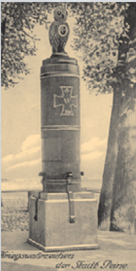
Die Peiner Eule als „Kriegswahrzeichen“ 1916.

Im Gegenteil wird berichtet: „Sie (die Peiner, Anm. d. Verf.) hatten wohl etliche Geschütze auf dem Walle, .. aber es geschah damit wenig Schadens.“