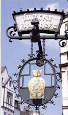
„Aushängeschild“ mit Symbolcharakter: Die Eule findet sich auch an einigen Gebäuden in der Peiner Innenstadt wieder.

Der Bürger ging sogleich mit in die Scheune; als er aber das greuliche Tier mit eigenen Augen sah, geriet er in nicht geringere Angst als der Knecht. Er lief, so schnell er konnte, und rief die ganze Nachbarschaft zu Hilfe.