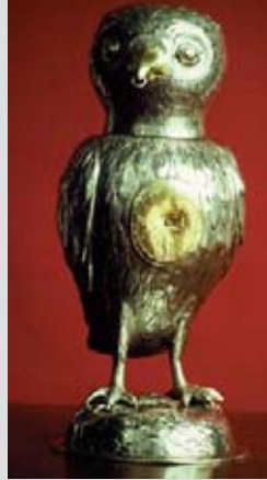
Der älteste erhaltene Eulenkoppe (von 1661). Er befindet sich heute im Kästner-Museum, Hannover.

Also ward die Scheune an allen vier Ecken angezündet und mit ihr die Eule jämmerlich verbrannt. Die Peiner aber müssen noch heutigentags das Gespött darum leiden, so sehr es sie auch verdrießt. Wer's nicht glauben will, der gehe nach Peine; doch hüte er sich, nach der Eule zu fragen!“