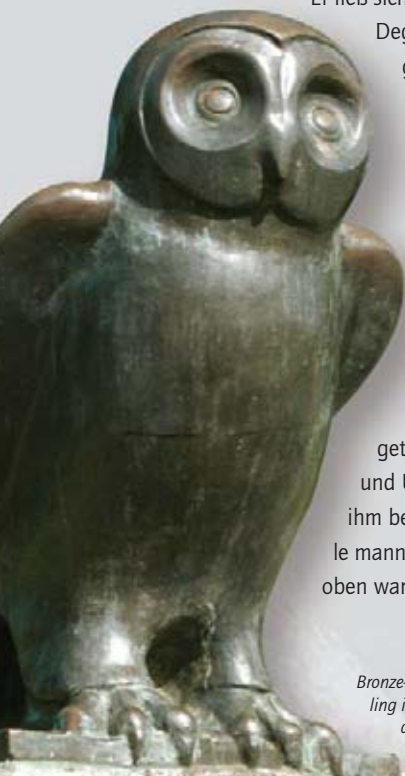
Bronze-Eule auf einem Findling im Eingangsbereich des Stadtparkes.

Er ließ sich also seinen Harnisch, Degen und langen Spieß bringen, dann legte er die Leiter an die Scheune, um allein hinaufzusteigen und zu sehen, was das Untier vermochte. Sein Vorgehen wurde von den meisten gelobt, manche aber waren um ihn besorgt; darum empfahlen sie ihn dem lieben Ritter St. Georg, der den Drachen getötet, wünschten ihm Kraft und Überwindung und riefen ihm beim Hinaufsteigen zu, er solle mannlich fechten. Als er aber bald oben war und die Eule sah, daß er