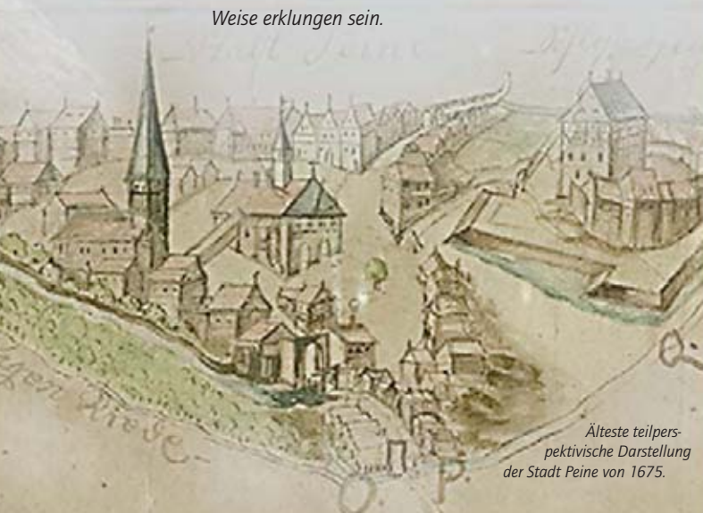
Älteste teilperspektivische Darstellung der Stadt Peine von 1675.

Bei dieser Darstellung ist anzumerken, dass es zu allen Zeiten der Fehde so kritisch um die Verteidigung der Burg gestanden hat, dass sicher alle vorhandenen Geschütze und Waffen ohne Ausnahme gebraucht wurden. Selbst in einem Kanonenrohr älteren Datums hätte eine Eule wohl kaum einen ruhigen Schlaf- oder Nistplatz gefunden. Nichtsdestoweniger kann natürlich ein Eulenschrei in beschriebener Weise erklingen sein.